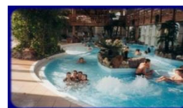
Le centre aquatique