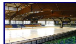
La Patinoire (58x28)

Notre centre d'entraînement est choisi sur des critères stricts de qualité d'installation et d'hébergement, de facilités de surveillance des stagiaires. Outre la patinoire, les stagiaires peuvent bénéficier gratuitement des installations suivantes : gymnase, salle de jeux, salle de danse, terrain de sport, TV-Vidéo... L'enseignement du sport est adapté au niveau du stagiaire.