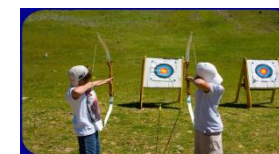
Le tir à l'arc Règlement intérieur