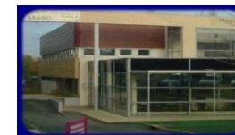
Le restaurant Activités